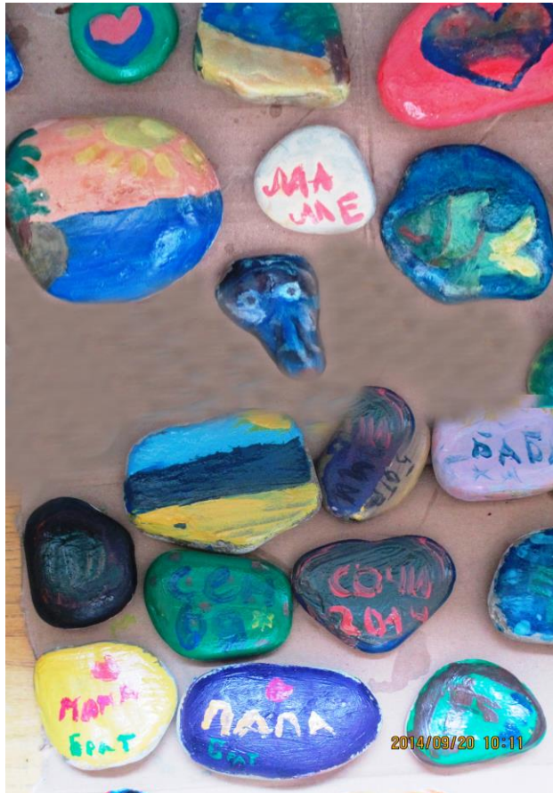
Рис. 2. Фотография детских рисунков на камнях